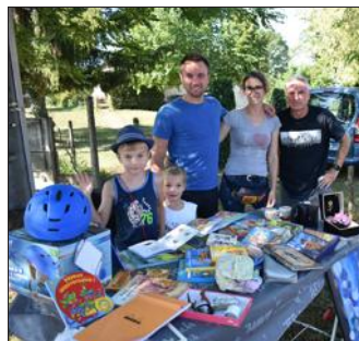
Des exposants locaux.

Ce dimanche 4 août se déroulait la 19 e édition du vide grenier des Gaboureux. Plus de 200 exposants venus du département et de la région Rhône-Alpes étaient présents, un record. Très tôt, de nombreux visiteurs chinjaient à la recherche de l'objet rare. Au fil de la journée l'affluence était toujours soutenue. Vers 17 heures, la présidente de l'association Karine Pau-