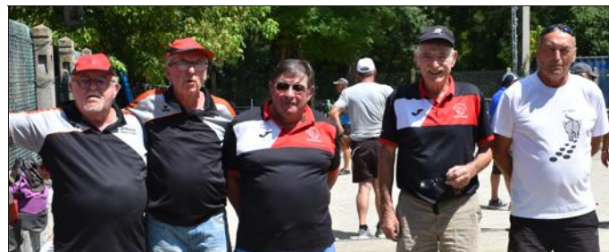
Les doublettes locales.

La boule des écoles de Saint-Maurice-de-Gourdans a organisé, lundi 5 août, le concours de la société. Ce concours affichait complet avec 24 doublettes. Le matin